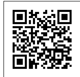
แบบประเมินมาตรฐาน ศพอส. ปี 2564 ออนไลน์ (Google)