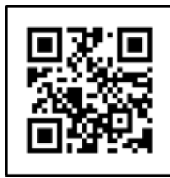
คู่มือมาตรฐานการดำเนินงาน ศพอส.