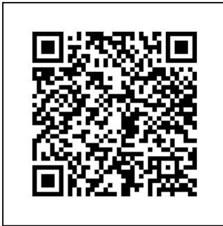
แบบรายงานแผนและผลการดำเนินงาน ศพอส. ปี 2564