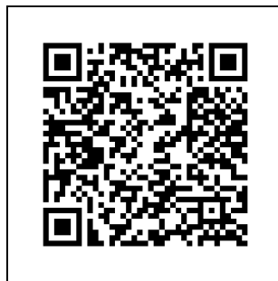
(แบบ รบ.ผส. 01) / (แบบ รบ.ผส. 02) / (แบบ รบ.ผส. 03)