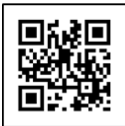
คู่มือการดำเนินงาน ศพอส.