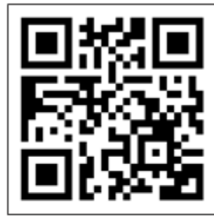
รายชื่อพื้นที่ในการจัดตั้ง ศพอส. ปี 2564