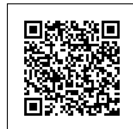
ทะเบียนข้อมูลรายชื่อ ศพอส.