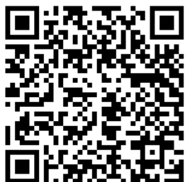
แบบ คปญ. 2