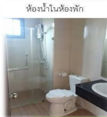
ห้องน้ำในห้องพัก