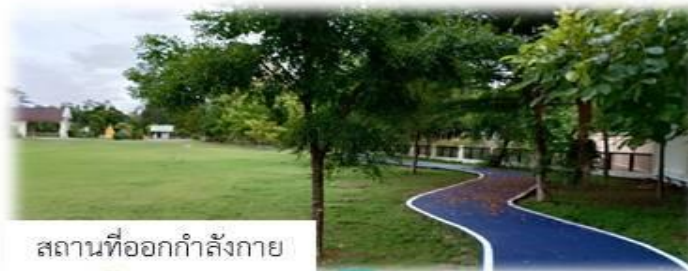
สถานที่ออกกำลังกาย