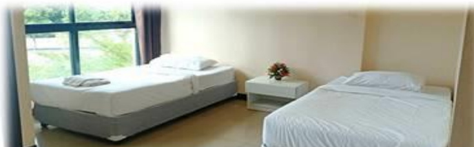
ห้องพักจำนวน 24 ห้อง (ขนาด 5X5 เมตร)