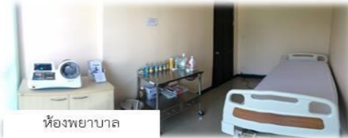
ห้องพยาบาล