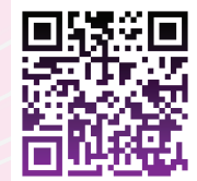
QR Code : นโยบายและแผนระดับชาติว่าด้วยการพัฒนาดิจิทัลเพื่อเศรษฐกิจและสังคม