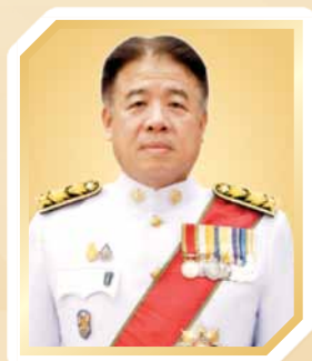
นายไชติ ตราชู ปลัดกระทรวงการท่องเที่ยวและกีฬา