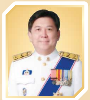
นายจตุพร บุรุษพัฒน์ ปลัดกระทรวงทรัพยากรธรรมชาติและ สิ่งแวดล้อม