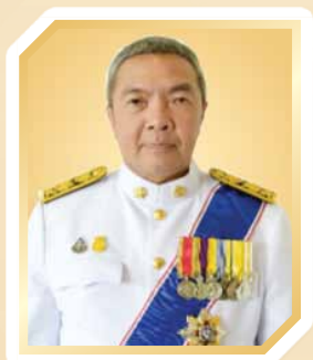
หม่อมหลวงพัชรภากร เทวกุล เลขาธิการ ก.พ.