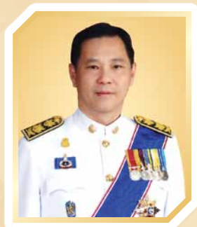
นายชัยวัฒน์ ทองคำคูณ ปลัดกระทรวงคมนาคม