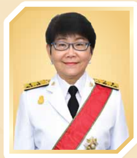
นางบุษยา มาทแล็ง ปลัดกระทรวงการต่างประเทศ