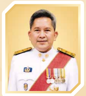
นายปรเมธี วิมลศิริ ปลัดกระทรวงการพัฒนาสังคม และความมั่นคงของมนุษย์