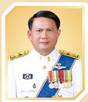
นายประเสริฐ บุญเรือง ปลัดกระทรวงศึกษาธิการ