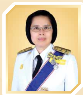
นางสาวอ้นฟ้า เวชชาชีวะ เลขาธิการ ก.พ.ร.