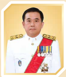
ศาสตราจารย์พิเศษวิศิษฎ์ วิศิษฎ์สรอรรถ ปลัดกระทรวงยุติธรรม