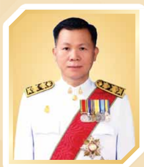
นายกฤษฎพงษ์ ศรี ปลัดกระทรวงวัฒนธรรม