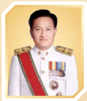
นายสุทธิ สุโกศล ปลัดกระทรวงแรงงาน