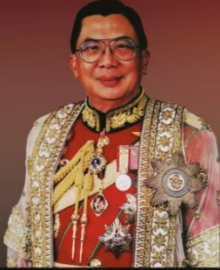
ฯพลฯ พล.อ.ชวลิต ยงใจยุทธ อดีตนายกรัฐมนตรี