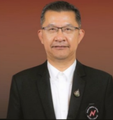
ดร.ธีรภัทร ประยูรสิทธิ อดีตนายกรัฐมนตรี อดีตนายกรัฐมนตรี