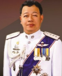
พล.ต.อ.ดร.เรืองศักดิ์ จริตเอก อดีตรองผู้บัญชาการตำรวจแห่งชาติ สมาชิกสภานิติบัญญัติ ที่ปรึกษารัฐมนตรีว่าการกระทรวงยุติธรรม