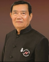
ฯพลฯ อำนวย ปะติเส อดีตรัฐมนตรีช่วยว่าการกระทรวง เกษตรและสหกรณ์ อดีตรัฐมนตรีช่วยว่าการกระทรวงการคลัง