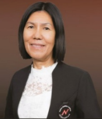
ท่านประภุชพร กำเหนิดฤกษ์ อธิบดีผู้พิพากษาศาลอาญากรุงเทพ และประพฤตินิเทศน์ ภาค 9