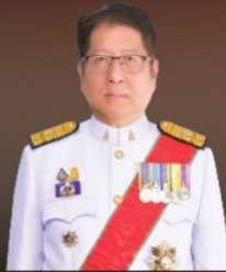
ท่านโพรชัย พรสมบูรณ์ศิริ อัยการสูงสุด