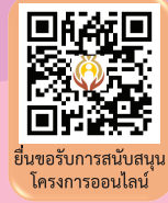
ยื่นขอรับการสนับสนุนโครงการออนไลน์